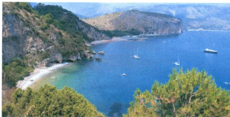
Baia del Buondormire

Nel pomeriggio partenza per Roma con sosta a Paestum per acquistare ( chi vuole ) prodotti caseari del Cilento presso il caseificio "Il Granato". prosecuzione del viaggio con rientro a Roma in serata.